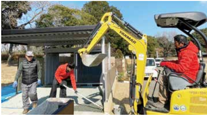
植木まつりの準備の様子