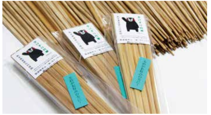
お箸は好みの太さに調整できます