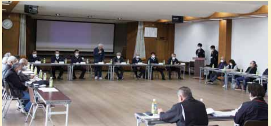
支所運営委員会の様子

ンが平成16年に購入したもので古く、早目の更新をお願いしたい。 A 現状、益城管内で100haの作付けあり、整備を実施しながら運用していますが、今後の作付け動向等考慮し、固定資産取得が必要であれば導入の検討を行ってまいります。