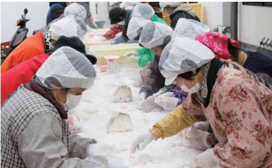
手作りのお餅は好評でした

12月28日、JAかみましき農産物直売所とれたて市場嘉島店で餅つきを行いました。餅つきは、毎年年末に行っており、地元の餅米で作るお餅は、その場でついた出来たてを販売するため好評で、今年も早々に完売いたしました。