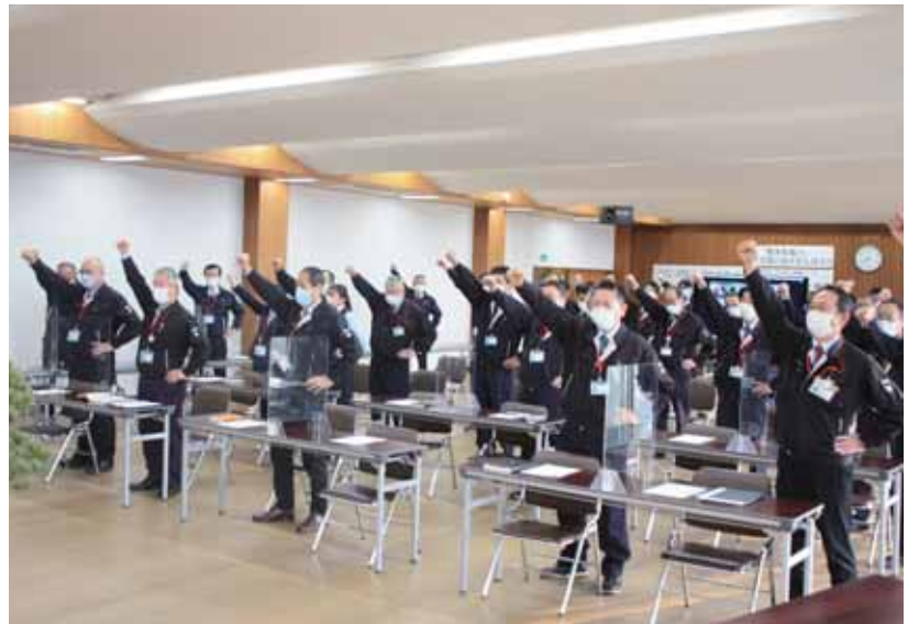
ガンバロー三唱を行う役職員