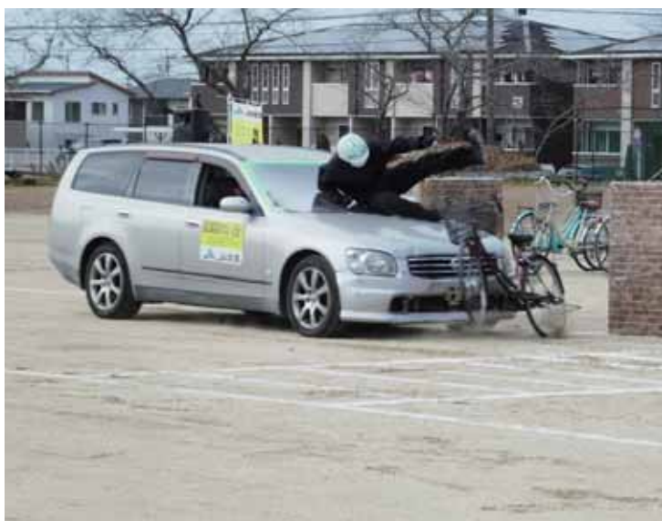
スタントマンが事故を再現しました

J A かみましきは16日に熊本県立御船高等学校グラウンドで自転車交通安全教室を開催しました。スタントマンが危険な自転車走行での交通事故を再現。生徒に事故の危険性と正しい自転車の乗り方を伝え、事故のない社会を目指します。 近くから見ていた生徒は「交通事故の再現を間近で見ると迫力がすごい。交通ルール違反がどれだけ危険か改めて考えさせられた」と話していました。