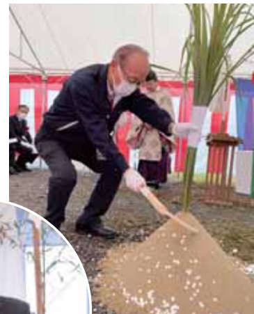
工事の安全を願う神事に臨む 田原組合長