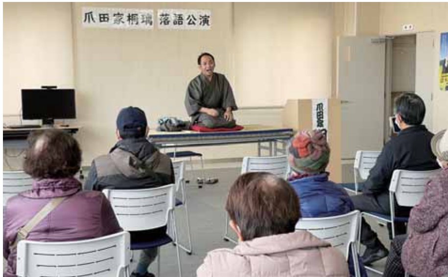
落語を披露する職員

12月15日、御船、甲佐、嘉島、清和の4支所で年金感謝デーを開催しました。抽選会や当JA職員による落語の公演など各支所工夫を凝らしたおもてなしで組合員・地域の方々に日頃の感謝を伝えました。 多くのご来場ありがとうございました。